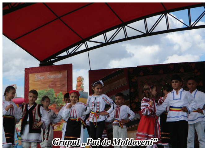
Grupul „Pui de Moldoveni”