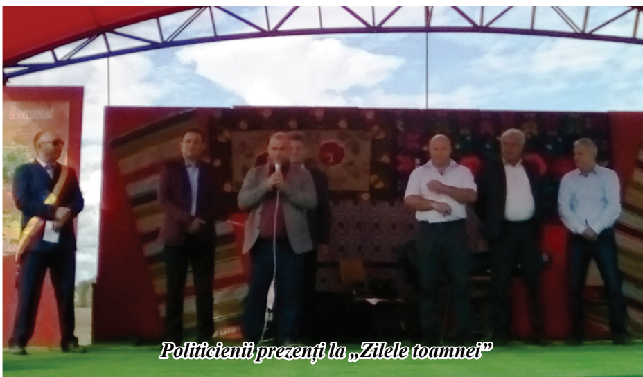
Politicienii prezenți la „Zilele toamnei”