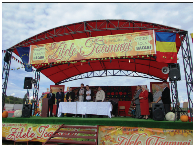
Slujba de binecuvântare a familiilor ajunse la nunta de aur

A V-a ediție a „Zilelor Toamnei” la Băcani a avut loc pe 24 septembrie 2017, când s-au adunat cu mic cu mare săteni din toată comuna pentru a celebra roadele toamnei și bucuria de a fi împreună.