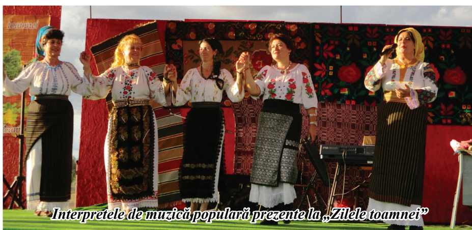
Interpretele de muzică populară prezente la „Zilele toamnei”